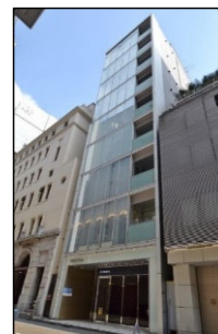
FPG links GINZA