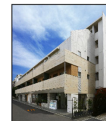
プラチナコート広尾