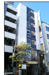
FPG links EBISU